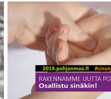
Ditt Sinun ÖSTERBOTTEN | POHJANMAASI