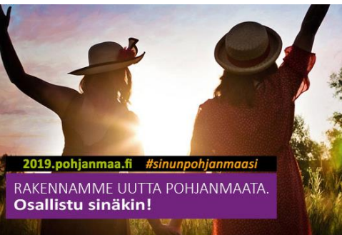
Ditt Sinun ÖSTERBOTTEN | POHJANMAASI