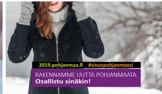
Ditt Sinun ÖSTERBOTTEN | POHJANMAASI