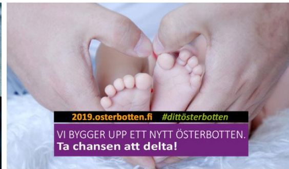
Ditt Sinun ÖSTERBOTTEN | POHJANMAASI