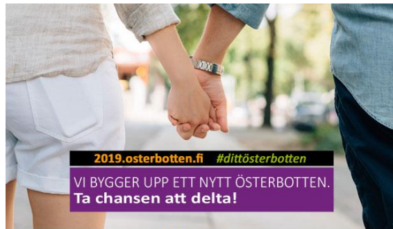
Ditt Sinun ÖSTERBOTTEN | POHJANMAASI